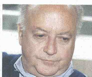
El chileno Jorge Edwards, autor de 'Persona non grata'