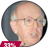
33% Richard A. Posner